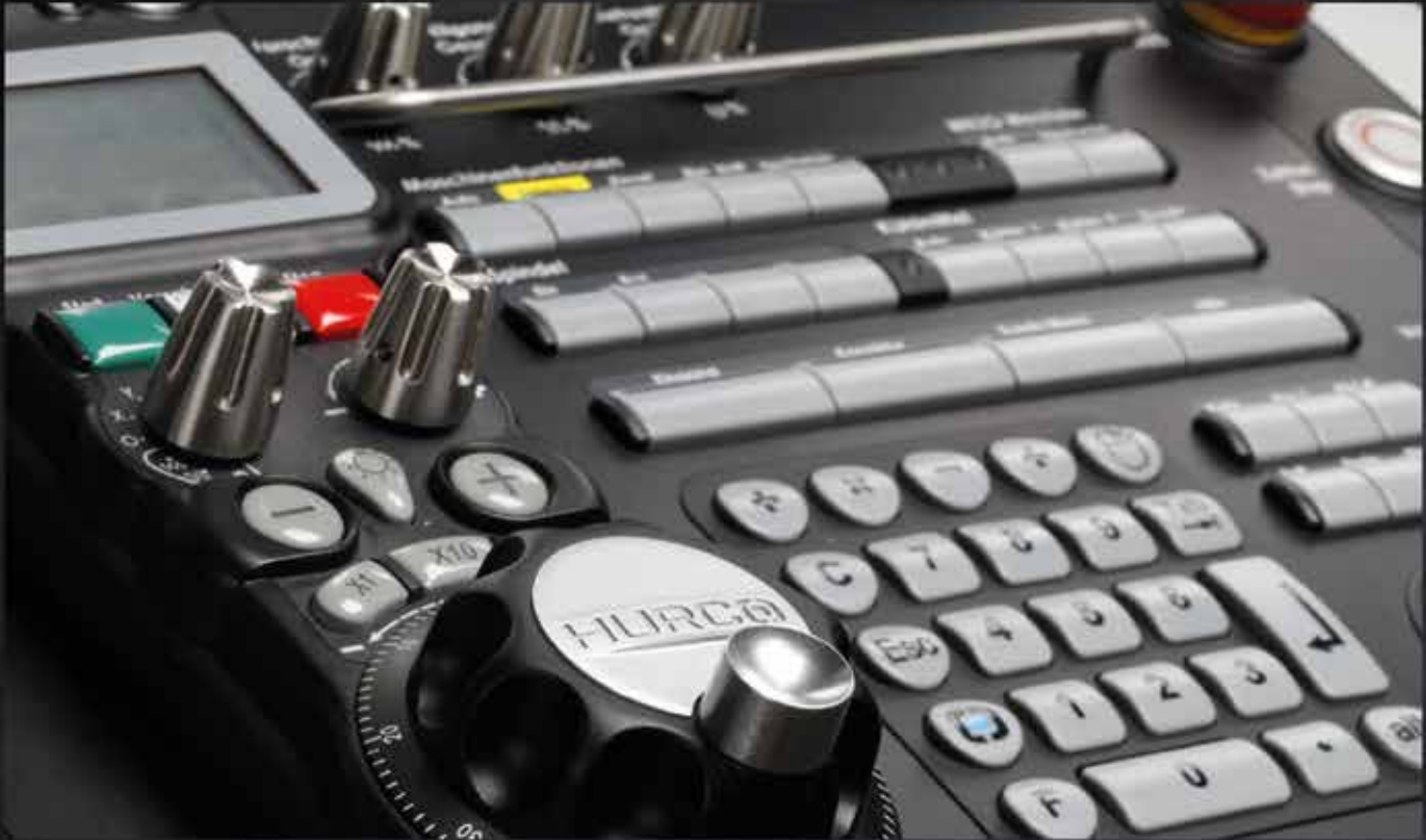
HURCO CNC-Steuerung MAX ® 5 mit elektronischen Handrad.

Die HURCO CNC-Steuerung steigert die Rentabilität – am schnellsten vom Entwurf bis zum fertigen Werkstück.